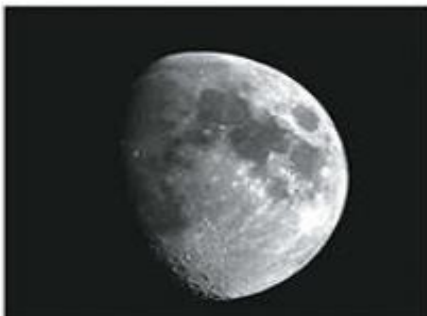
Luno vidimo, ker se od njenega površja odbija svetloba Sonca.

Svetloba se širi od svetila na vse strani. Širi se skozi prozorne snovi (zrak, voda, steklo) in skozi prazen prostor v vesolju. Predmete, ki ne oddajajo lastne svetlobe, lahko vidiš, če se svetloba od njih odbija. Predmeti del svetlobe vpijejo, zato se segrejejo, če so dolgo na soncu. Za osvetljenimi predmeti nastane senca.