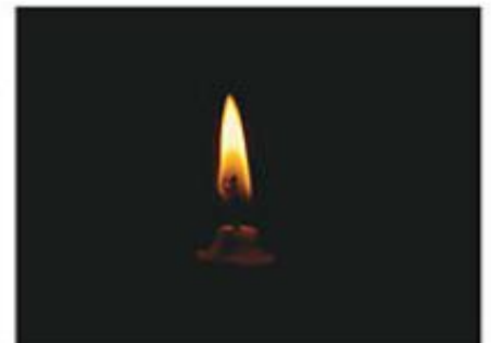
V temi ne vidimo predmetov, ker se od njih ne odbija svetloba.