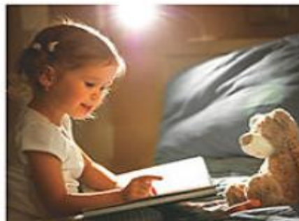
Deklica vidi knjigo, ker se od nje odbija svetloba luči.